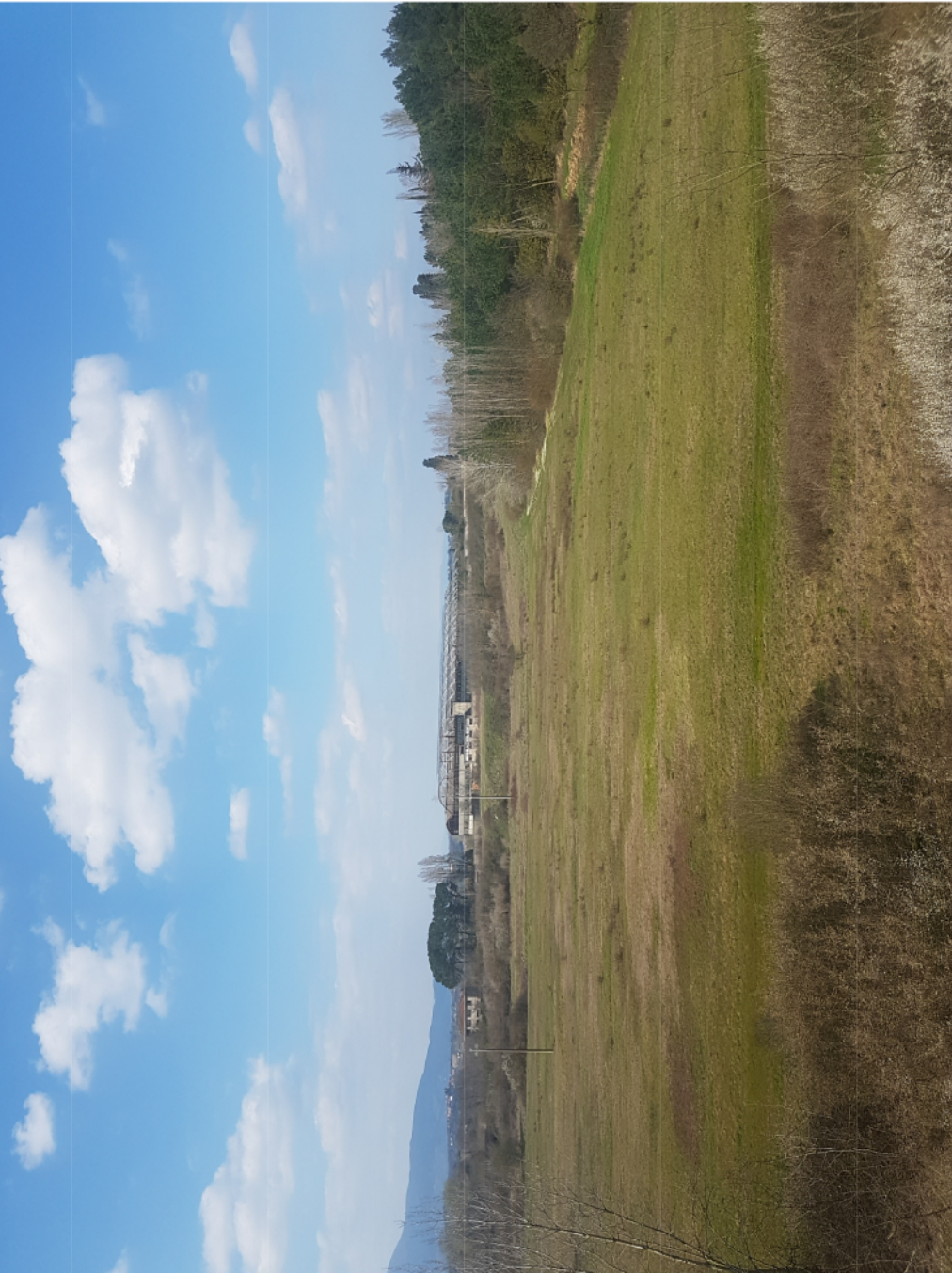
Attuale - VISTA 2