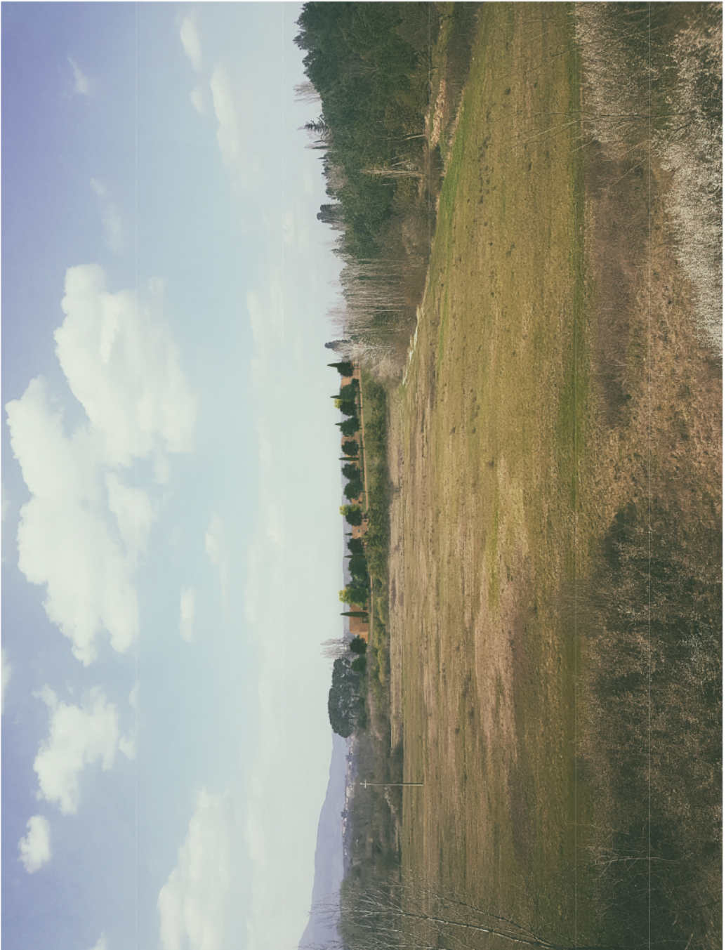
Fotoinserimento - VISTA 2