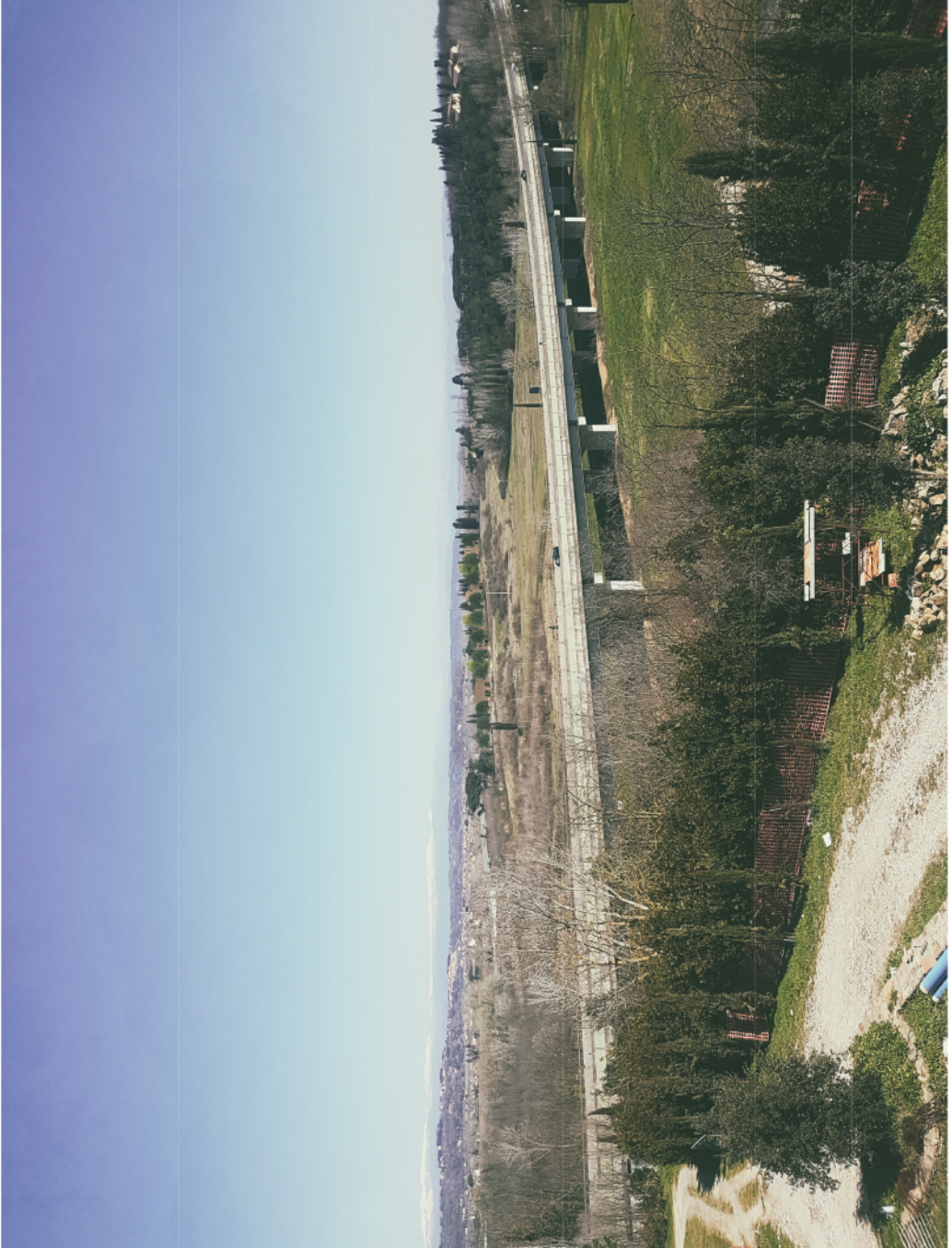
Fotoinserimento - VISTA 3