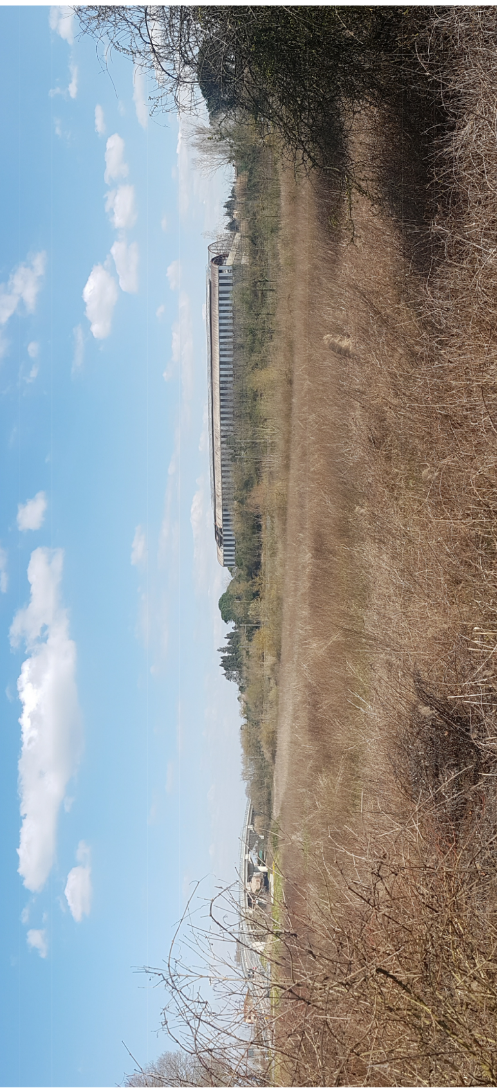
Attuale - VISTA 1