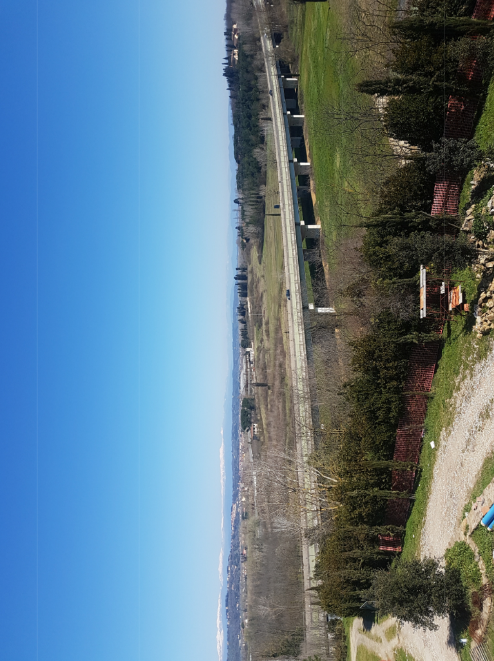
Attuale - VISTA 3