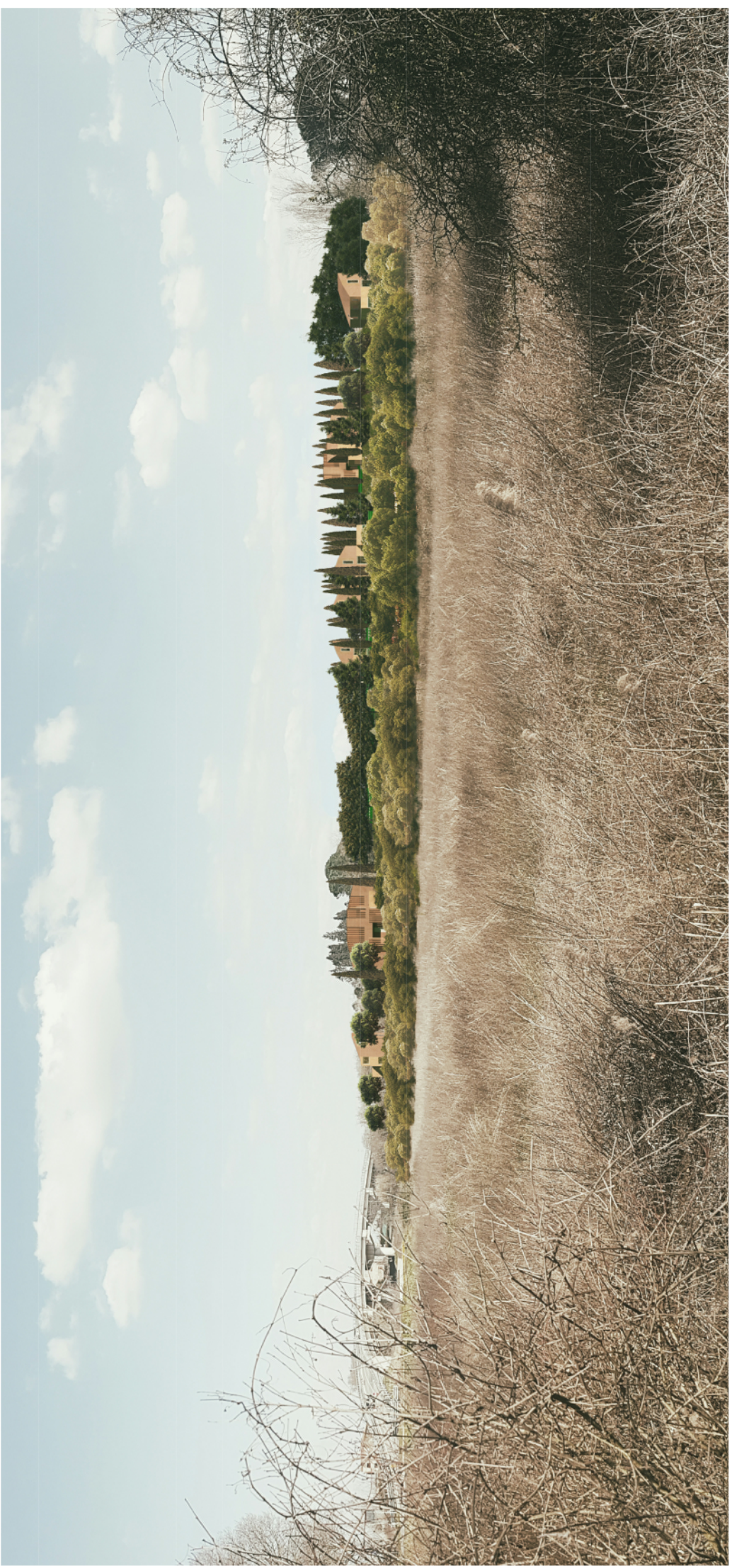
Fotoinserimento - VISTA 1