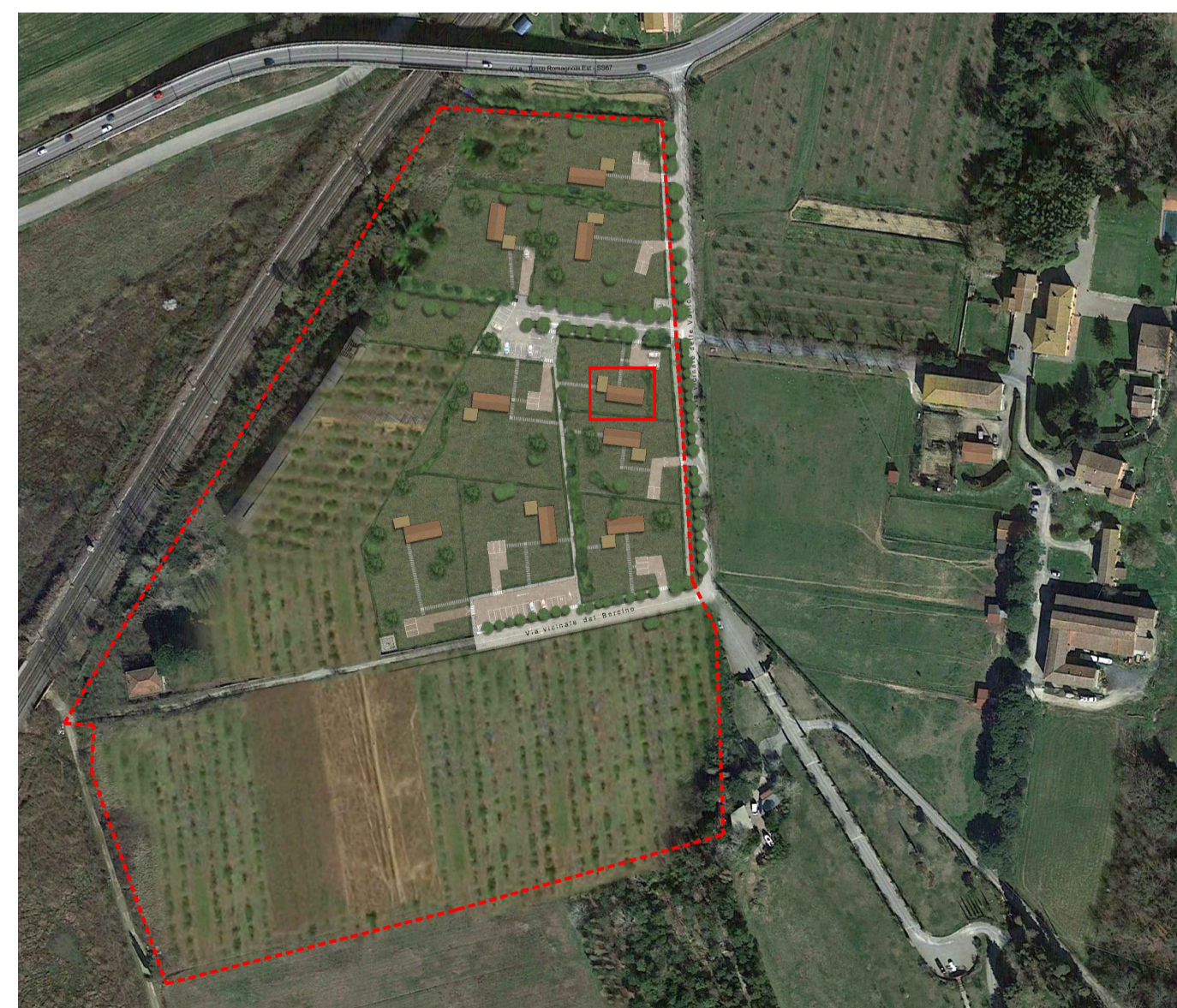
Planimetria - fuori scala □ Dettaglio singolo intervento

DISEGNO DI PROPRIETÀ DELL'ARCHITETTO ANDREA MANNOCCI - TUTTI I DIRITTI RISERVATI A NORMA DI LEGGE